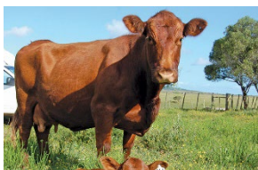
Alimentar el ganado, procesamiento, embalaje