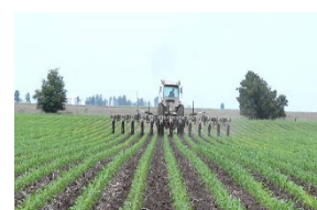
Cultivo, preparación de suelo