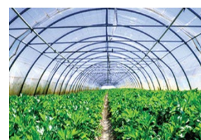
Invernadero, Vivero, Sod