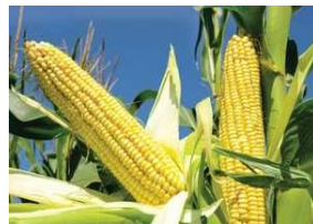
Cosecha (Verduras Y Frutas)